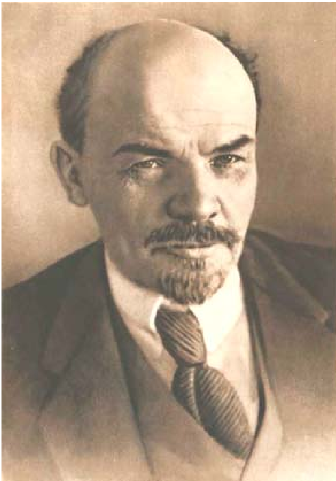
В. И. ЛЕНИН 1918