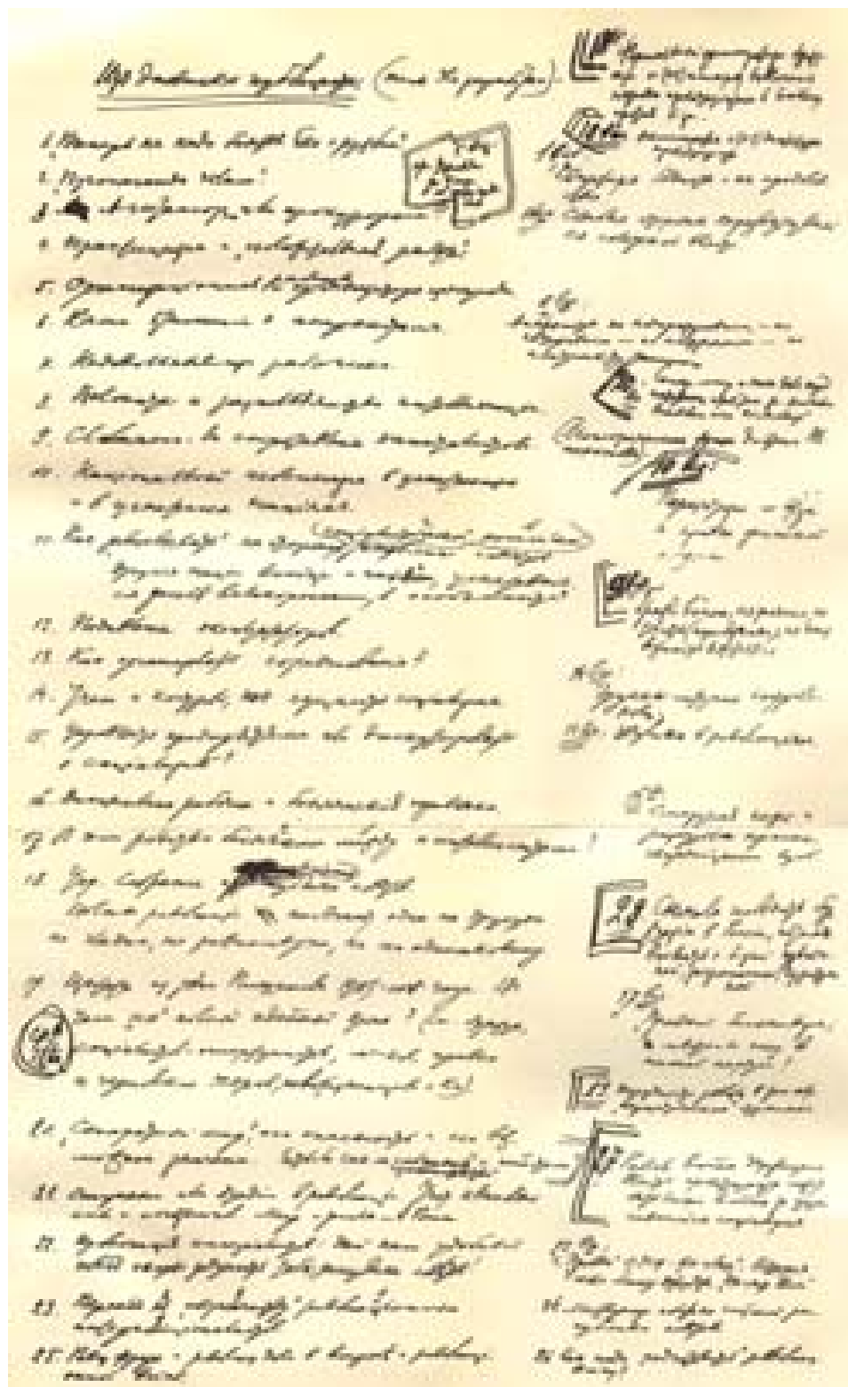
Первая страница рукописи В. И. Ленина «Из дневника публициста (Темы для разработки)». — Конец декабря 1917 г.